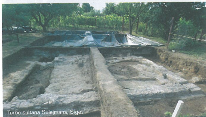
Turbe sultana Sulejmana, Siget