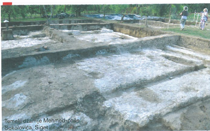
Temelji džamije Mehmed-paše Sokolovića, Siget