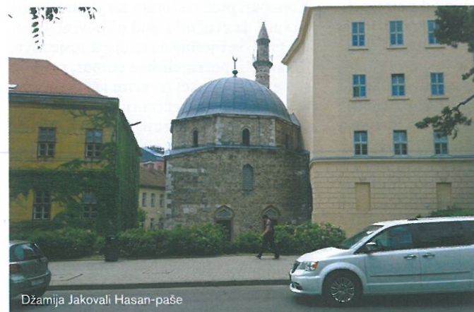
Džamija Jakovali Hasan-paše

“Tri glavna sultana koja su odredila historiju Carevine doslovno su umrla na konju. Posljednji je od njih sultan Sulejman, čije je tijelo preneseno u Istanbul i ukopano u turbetu kod njegove džamije Sulejmanije, a unutrašnji organi ostali su u Mađarskoj”, ispričao je Obranović.