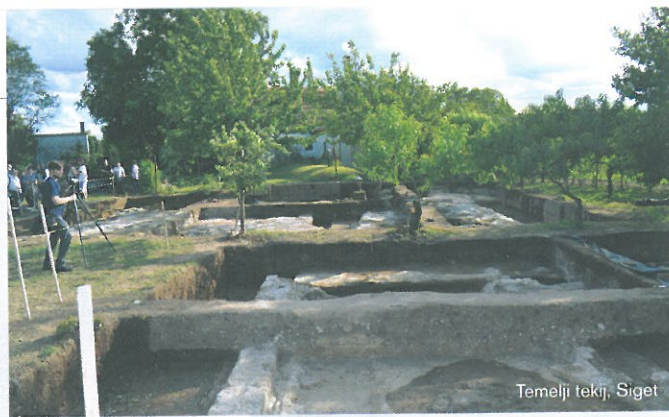
Temelji tekij, Siget