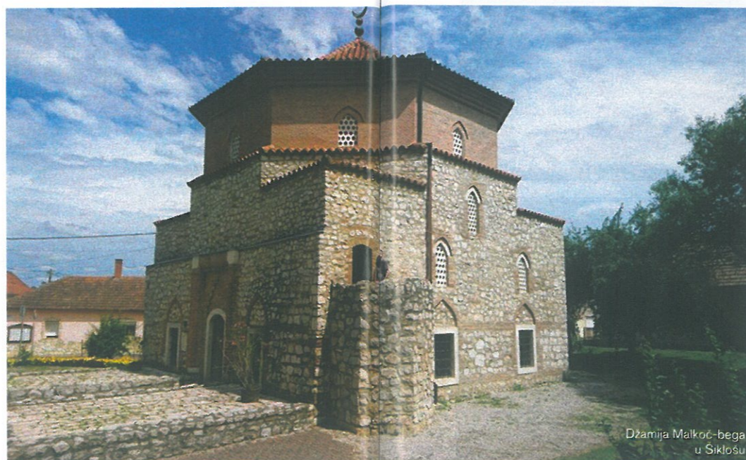
Džamija Malkoč-bega u Siklošu

U prvoj fazi arheoloških iskopavanja pronađeni su temelji turbeta sultana Sulejmana, u koji su bili spuštene njegovi unutrašnji organi. Turbe je izgradio sultan Selim, Sulejmanov sin, a pored su bili džamija Mehmed-paše Sokolovića i tekija. Kompleks je udaljen četiri kilometra od centra Sigeta. Ove građevine srušene su nakon što je Siget osvojila austrijska vojska i istjerala Osmanlije poslije poraza pod Bečom 1653. godine. Isto se desilo s golemom većinom osmanske arhitekture u Ugarskoj, skoro je sva do temelja srušena.