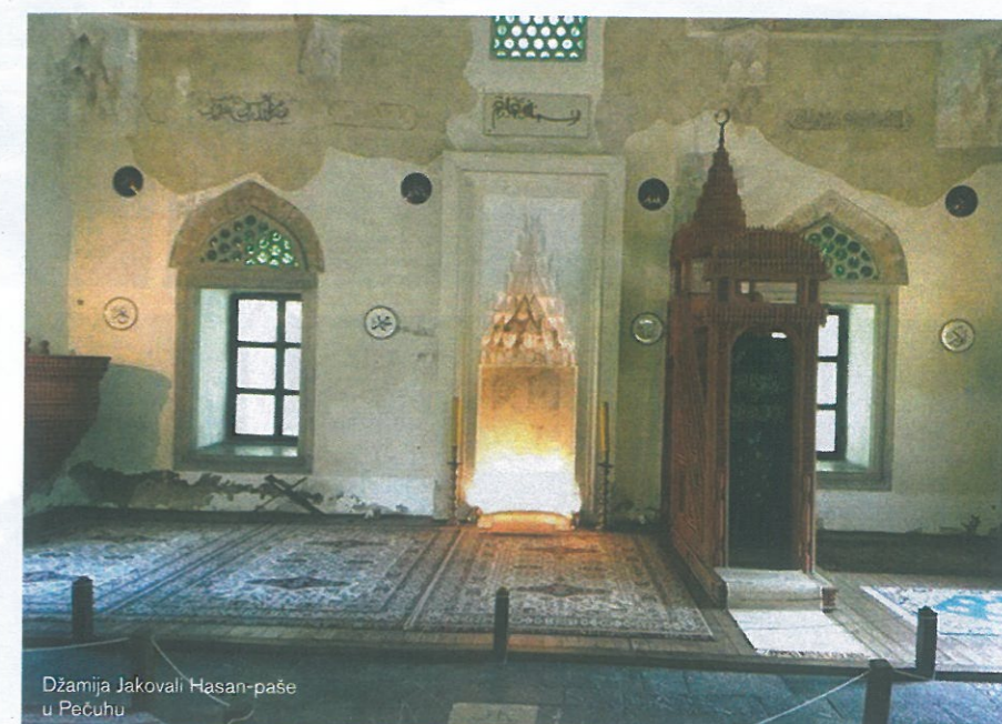
Džamija Jakovali Hasan-paše u Pečuhu