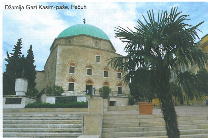
Džamija Gazi Kasim-paše, Pečuh