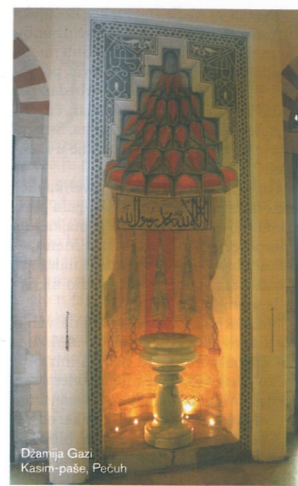
Džamija Gazi Kasim-paše, Pečuh

U historiji je ostalo zapisano da je sultan Sulejman umro osvajajući sigetsku tvrđavu, ali do sada nije bilo poznato gdje se nalazi njegovo turbe. Naime, osmanski su vojnici cijelo ljeto osvajali tvrđavu Siget, koja ih je spriječila da nastave prema Beču. Prije nego što je završeno osvajanje tvrđave, koja se nalazila na vodi i bila je sastavljena od više manjih utvrda koje je trebalo zasebno osvajati, pod zidinama je umro sultan Sulejman. Veliki vezir Mehmed-paša Sokolović krio je od vojske sultanovu smrt, te je, da se tijelo ne bi počelo raspadati, njegove unutrašnje organe, prema predaji, stavio u zlatnu posudu i zakopao. Poslije je na tom mjestu napravljena turbe. Vojska je osvojila Siget, ali se vratila nazad u Istanbul, a za smrt sultana saznali su tek u Beogradu kada je princ Selim proglašen za novog sultana.