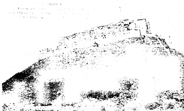
Tvrđava u Doboju