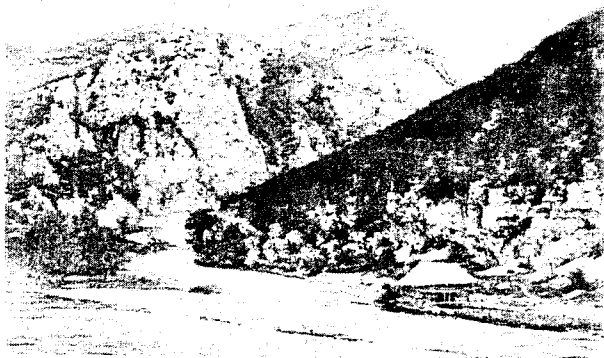
Ostaci tvrđave Bočac, na vrhu stijene

Bočac: Prvu posadu Bočca, koja se u izvorima javlja od 1530. g., činili su graničari-ulufedžije među njima i imam. Do 26. ramazana 946