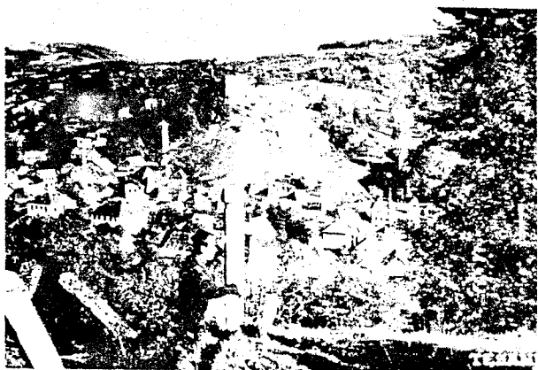
Ostaci tešanjске tvrđave u drugoj polovini 19. i početkom 20. vijeka

Tešanj: Približno u isto vrijeme kada se to dogodilo u Doboju nastala je džamija u tvrđavi Tešanj. Vjerovatno je već tada u njemu postojala i posada o kojoj pisane tragove srećemo 1530. godine. U to vrijeme ona je isplaćivana u novčanim iznosima do 1540. godine. Prvi poznati imam u Tešnju tih godina bio je Mustafa, čije približno vrijeme stupanja niti prestanka službe nije poznato.